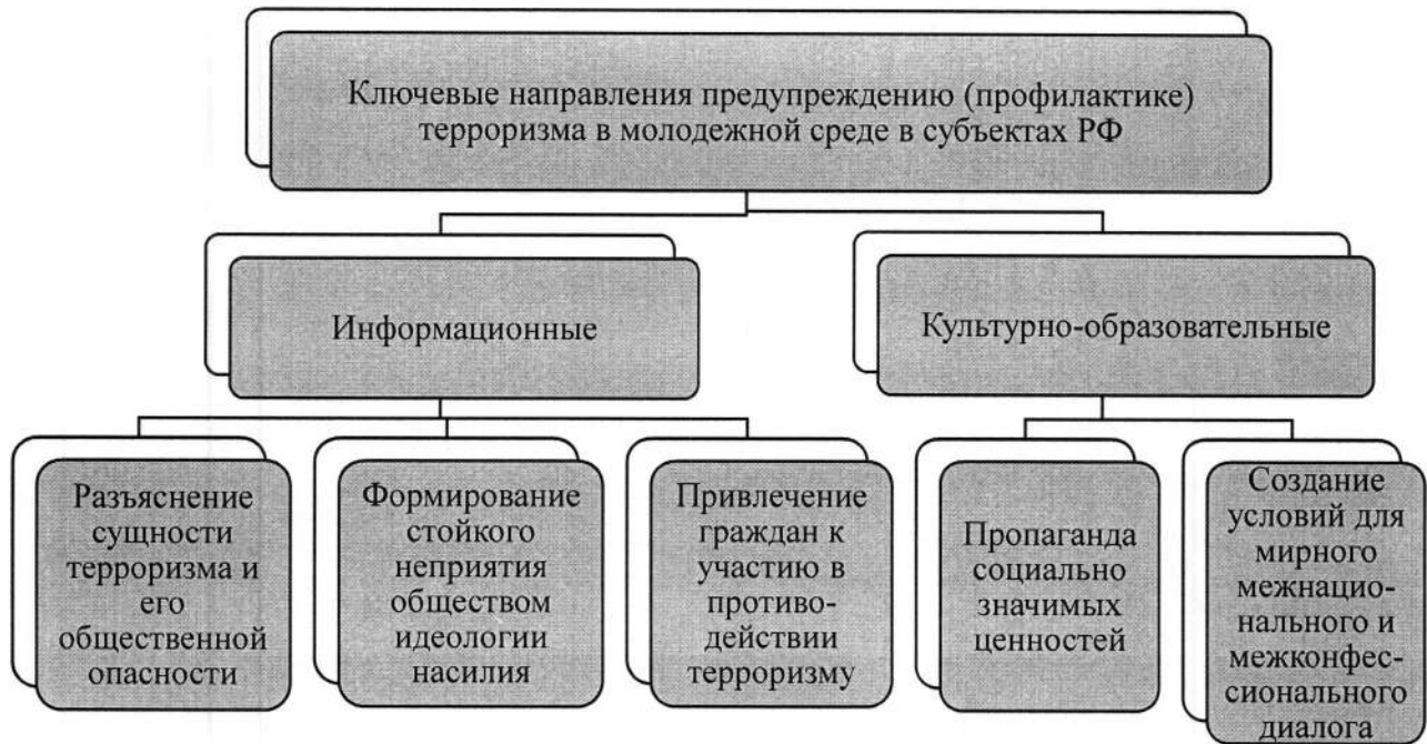
Рисунок 1. Ключевые направления предупреждению (профилактике) терроризма

Перечисленные выше направления реализации Комплексного плана предполагают следующие форматы проведения мероприятий: